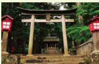
18 富士登山道吉田口