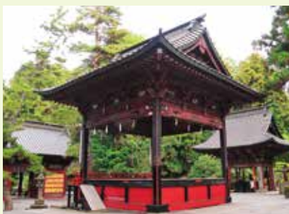
5 神楽殿 (国指定重要文化財)