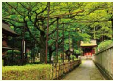
12 七色もみじ (名木百選選定)