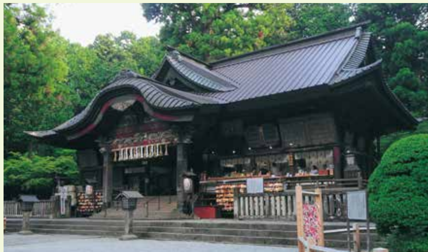
9 拜殿 (国指定重要文化財)