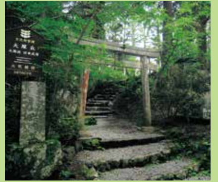
39 大塚丘 (当社発祥の地)