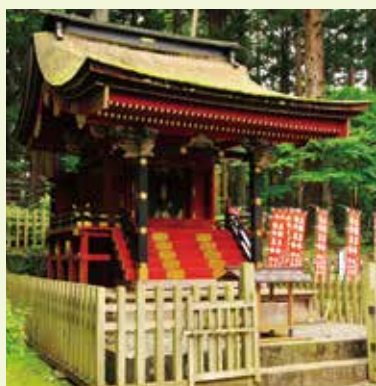
15 東宮 (国指定重要文化財)