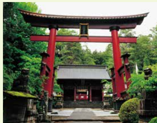
2 大鳥居 (日本最大木造鳥居)