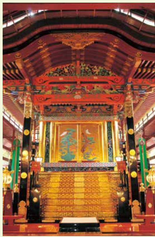
10 本殿 (国指定重要文化財)