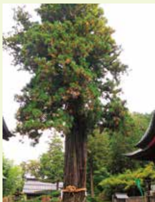
7 太郎杉 (県指定天然記念物)