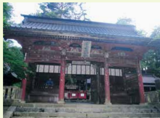
4 随神門 (国指定重要文化財)