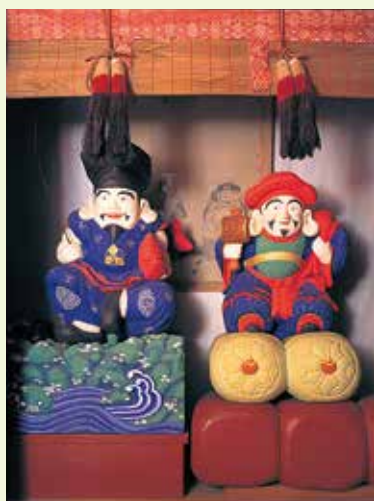
11 富士桑びす (国指定重要文化財)