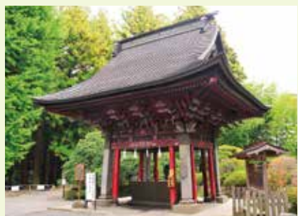
6 手水舎 (国指定重要文化財)