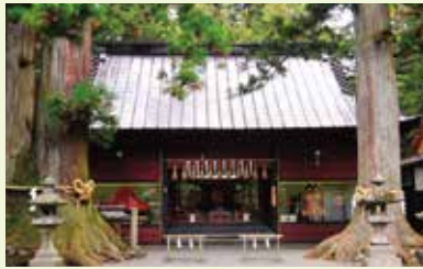
33 諏訪拜殿 (国指定重要文化財)