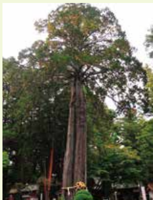
8 夫婦松 (市指定天然記念物)