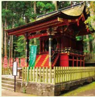
16 西宮 (国指定重要文化財)