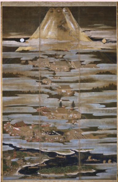
重要文化財『絹本着色富士曼茶羅図』